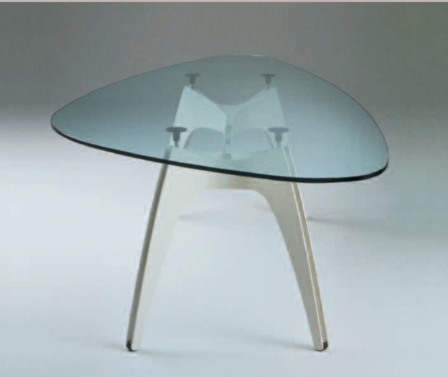
Table with lacquered structure made with two paired off steel sheet. Glass top thickness 15 or 19 mm. Available rectangular or shaped top 289x120 cm.

Tavolo con struttura in lamiera d' acciaio accoppiata e laccata. Float trasparente, spessore 15 o 19 mm. Disponibile nella versione rettangolare o asimmetrico 289x120 cm.