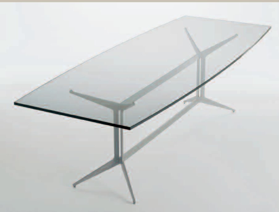
Table with steel base. Legs in laser-shaped steel sheet; rods in steel bar; joints in cast aluminium. Lacquered finish. Shaped or rectangular glass top, thickness 19mm.

Tavolo con base in acciaio. Montanti in lamiera sagomata al laser; traversi in trafilato; giunti in fusione di alluminio. Finitura verniciata. Float trasparente, spessore 19 mm. Disponibile nelle versioni sagomate o rettangolare.